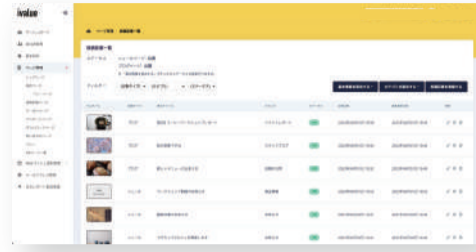
▲投稿記事一覧ページ