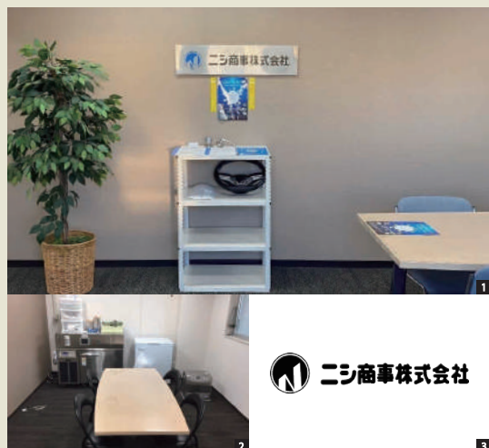
[1] ニシ商事さまのオフィスの様子 [2] 果物や肉類など実際に冷凍・解凍を行うことができるテストルーム [3] ニシ商事さまのロゴマーク

宮城県仙台市にある「ニシ商事株式会社」さまは、ラミネートフィルム事業、抗酸化特殊冷凍機販売事業、抗菌事業、包装機械事業の4つの事業を主軸に商品開発からパッケージデザインまでトータルプロデュースを行う、包装資材の専門商社です。創業から40年が経つ今も、お客さまのご要望に合わせた開発をし続けるニシ商事株式会社の代表取締役である西下さんに、ivalueを利用してみでの率直な感想をおうかがいしました。