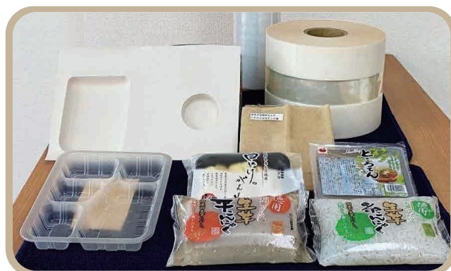
▲「包装資材」を利用し、商品に対応したパッケージ等をご提案から行っているラミネートフィルム事業

ることができたので、公開まで気軽に進められたと感じています。こちらの要望をしっかりとヒアリングしていただいたおかげで、満足するホームページが出来上がりました。