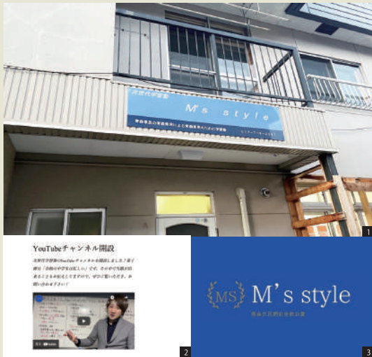
[1] 塾の外観 爽やかな水色の看板には、M's styleさまのスローガンが掲げられています [2] お知らせ投稿で各種SNSの情報発信も積極的に行われています [3] ホームページやSNSでも使用されているM's styleさまのロゴマーク