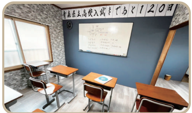
▲おしゃれな雰囲気の内装は、アットホームな温かさが感じられます

ない状態でした。そんな中でも、こちらの希望や想いを担当スタッフさんがしっかりとヒアリングしてくれて形になりました。管理画面の操作方法も事前に教えてもらい、簡単だったので文章など自分で入力できる範囲のものは公開前の製作段階から自分で編集していました。修正してほしい点は担当スタッフさんに連絡し、都度対応してもらっていたので、公開までスムーズに進めることができました。