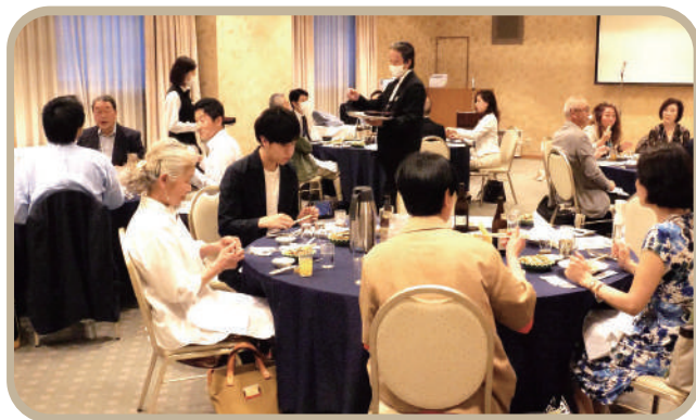
▲定例会での食事会の様子

伝えることができる雰囲気があると思いますし、実際にお客さまからのご好評の声を聞くと、ホームページは情報発信のツールとして最適だと実感しています。