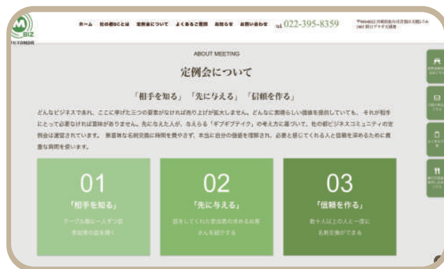
▲ グリーンを基調としたトップページのスクリーンショット

動しました。製品としての良さだけでなく、スムーズな打ち合わせや丁寧なヒアリング、ホームページ完成までのスピード感も含めてivalueを選んで良かったなと感じています。