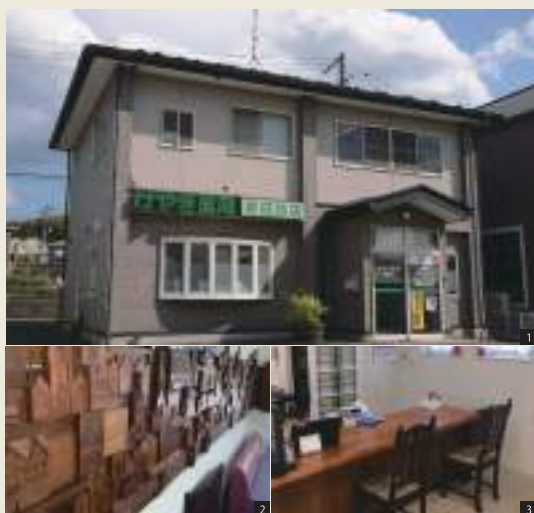
[1] 「けやき薬局吉成台店」の外観 [2] 落ち着きのあるこだわりの内装 [3] 患者さまが相談しやすいよう工夫された温かみのある店内

1994年より薬局の運営をする株式会社ノアさん。「けやき薬局」という名前でも30年近くの間、医薬品のエキスパートとして地域のみなさんの健康をサポートしてこられました。はじめは山形県の東根市にある小さな薬局からはじまり、今では宮城県と山形県にて13店舗の薬局を運営されています。信頼し安心してお薬を飲んでいただきたいという思いから、人と人とのコミュニケーションを大切にされている株式会社ノアさん。「いつでも気軽に相談できて、患者さまが笑顔になれるような薬局でありたい」と、患者さまを思うあついお気持ちをお話してくださいました。今回はホームページ制作にてご協力いただきました課長の黒川さんにivalueを利用して初めての率直な感想を伺いました。