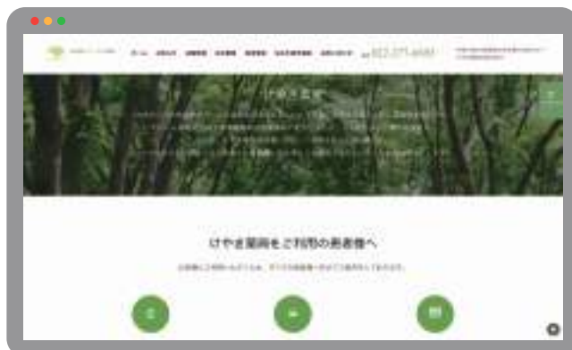
▲ けやき薬局さんのイメージに合わせたトップページのスクリーンショット

きたのでとてもよかったです。イメージを伝えると、あとはデザイナーの方がキレイに制作して下さったのでとても感謝しています。また、パソコンでの編集に不安がありましたが、初歩的な質問なども丁寧に対応して下さったので安心しました。