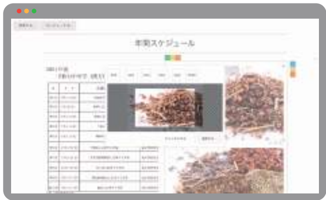
▲実際にホームページを編集している画面のスクリーンショット