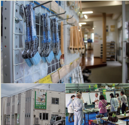
[1] 店舗に並ぶ販売商品の数々 [2] 店舗外観 [3] 年に1度の塗装教室の様子

青森県弘前市八幡町にある「株式会社ハヤシ」さんは、暮らしに寄り添う気持ちを大切にされている塗料専門商社様です。ただ塗料を販売されるだけではなく、屋根、外壁、室内の塗り替えをしたい、という方のサポートもされているハヤシさん。年に1度、各店舗にて塗装教室を開催するなど、相談できる塗料店として、人と人との関わりを大切にされています。プロ用から家庭用まで取り揃えておりますので、どんなお悩みでもお気軽にご相談ください。優しいお人柄に溢れる専門スタッフのみなさんが丁寧且つ、適切にアドバイスして下さいます。そんな塗料を通して地域の皆様の暮らしを豊かにし続ける、株式会社ハヤシさんにivalueを利用して初めての率直な感想を聞いてみました。