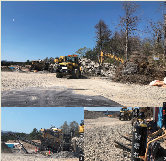
[1] 実際の処理場の様子 [2] 実際の処理場の様子 [3] 処理場での一枚

青森県青森市で産業廃棄物の処理を行う有限会社アールエスさん。普段から明るい接客を心掛け、ご相談しやすい環境づくりに力を入られているとのこと。そんなお客様を第一に考えるお気持ちが、安心と信頼に繋がっています。代表の三上さんは「がれき処理」という業種の会社があるということをもっとたくさんの人に知ってもらい、これからも業界を守りたいという熱い思いをお話してくださいました。今回業界のイメージを変える一歩としてivalueで制作した自社のホームページ。青森県で「がれき処分」と言えば「アールエス」と言ってもらえるよう、日々企業努力を続けるアールエスさんにivalueを使っての感想率直な感想をお伺いしました。