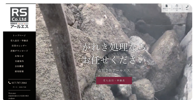
▲ホームページトップの動画のスクリーンショット

引越しもあり、急いでいたのでとても助かりました。テンプレートに沿って作っていったら、お客様にとっても見えやすく、弊社にとっても便利なページができ上がっていった感じです。素材についても、スマホで撮ったものを使用できますよと教えてもらったので、今まで許可どりで撮った写真を再利用でき、撮影コストが抑えられてたのも良かったです。